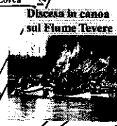
Discesa in canoa sul Fiume Tevere