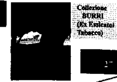
Collezione BURRI (Ex Essicatoio Tabacco)