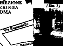
Centro delle Tradizioni Popolari